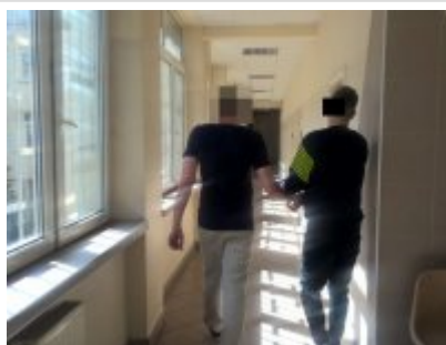
Mężczyzna zatrzymany przez policjantów