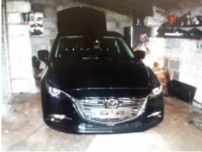
Odzyskana przez policjantów mazda