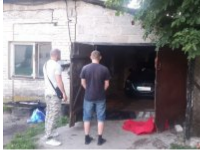
Policjant z zatrzymanym mężczyzną

Wypowiedź - Edyta Adamus, Wydział Komunikacji Społecznej KSP