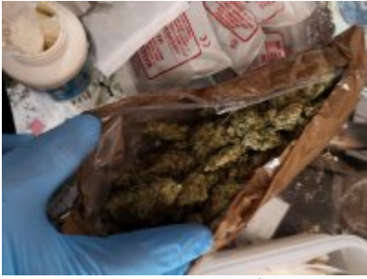
Zabezpieczone przez policjantów narkotyki