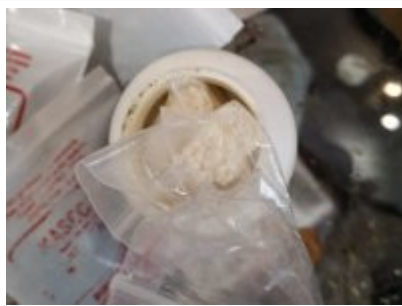
Zabezpieczone przez policjantów narkotyki