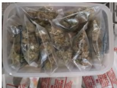
Zabezpieczone przez policjantów narkotyki