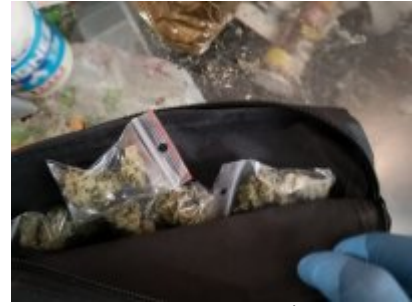
Zabezpieczone przez policjantów narkotyki