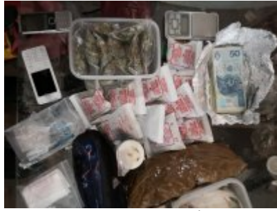
Zabezpieczone przez policjantów narkotyki